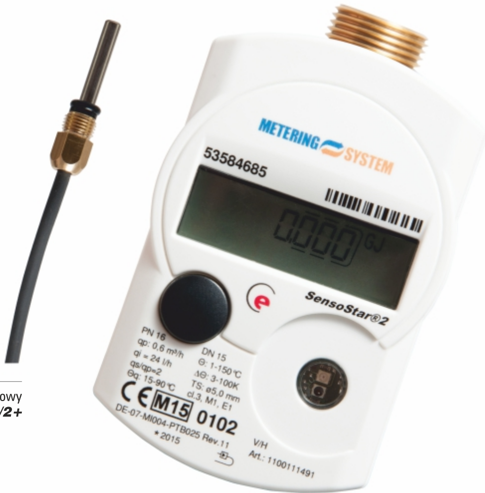
ciepłomierz kompaktowy SENSOSTAR ® 2/2+